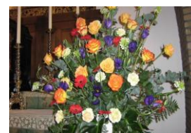
Eén van zijn vele bloemcreaties

Op zaterdag 14 april overleed een parochiaan op een gezegende leeftijd. De donderdag ervoor ontving hij in het bijzijn van zijn familie het sacrament der zieken. De eucharistieviering bij de uitvaart vond plaats in onze parochiekerk. Aansluitend hieraan werd in kleine kring afscheid van hem genomen in de aula van het crematorium van begraafplaats Amersfoort in Leusden. We bidden dat hij mag rusten in vrede.