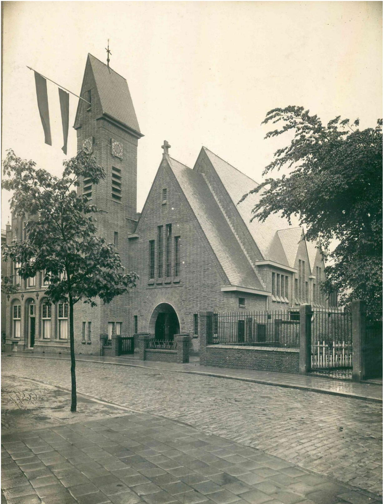
22 mei 1928 Kerkwijding